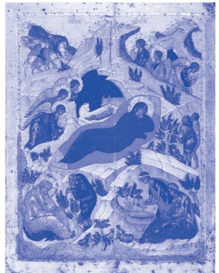
Icône de la Nativité

Après avoir vu, ils racontèrent ce qui leur avait été annoncé au sujet de cet enfant. Et tous ceux qui entendirent s'étonnaient de ce que leur racontaient les bergers. Marie, cependant, retenait tous ces événements et les méditait dans son cœur. Les bergers repartirent ; ils glorifiaient et louaient Dieu pour tout ce qu'ils avaient entendu et vu, selon ce qui leur avait été annoncé. » (Luc 2, 1-20)